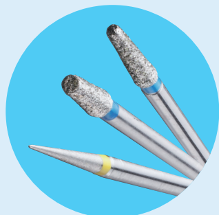
歯を削る器具 (ダイヤモンドバー)