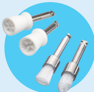
歯をクリーニングする器具 (プロフィーブラシ・カップ)